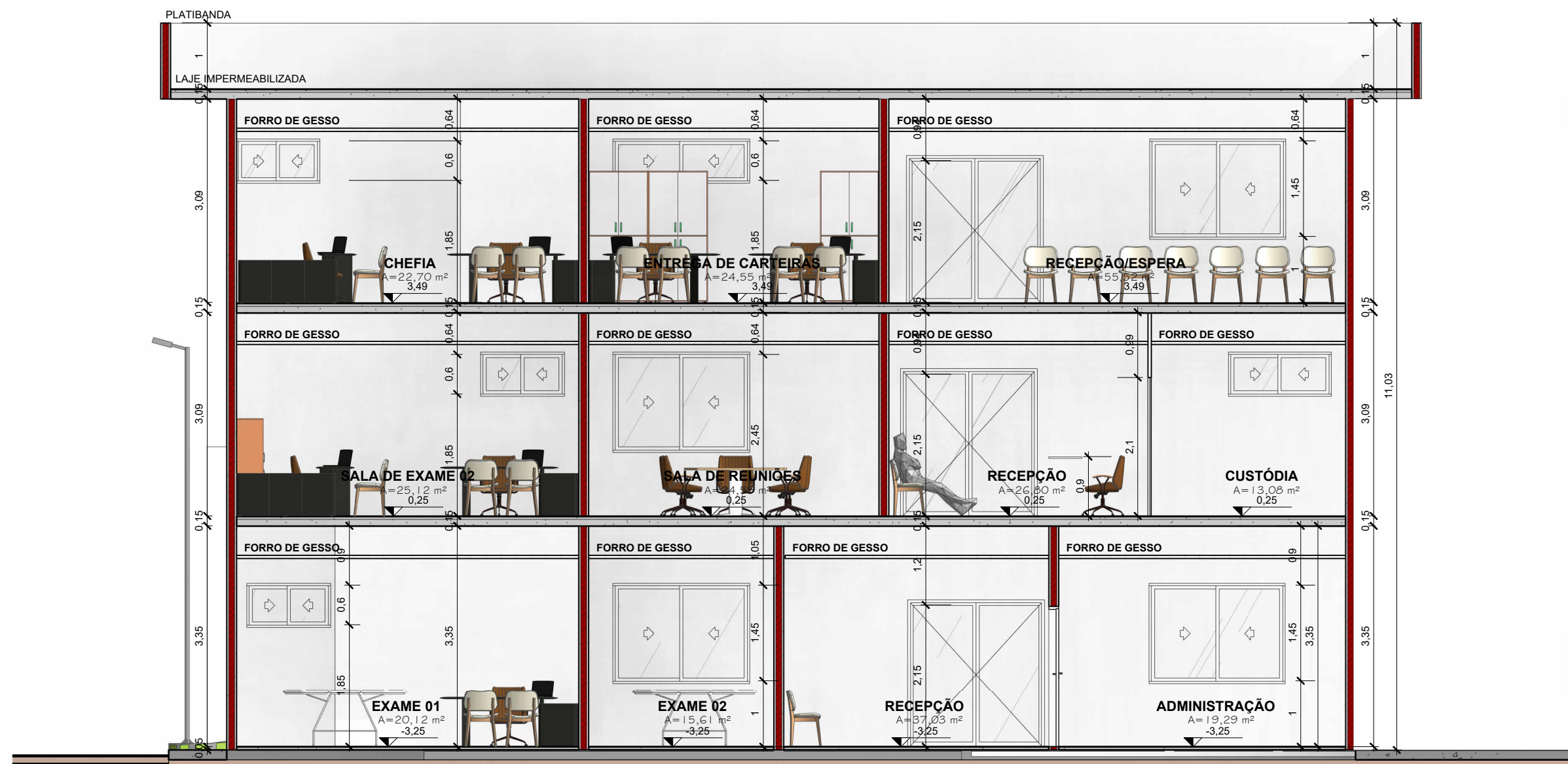
COGERP - Corte 4 ESCALA 1 : 75